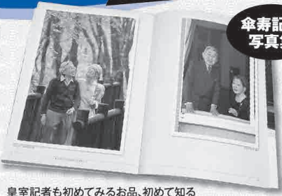
皇室記者も初めてみるお品、初めて知るエピソードが満載。宮内庁侍従職監修による永久保存版!